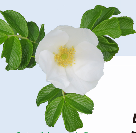
シロバナハマナス